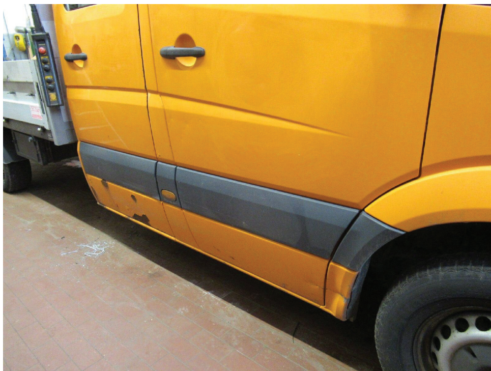
Bild 9 : Kniestück Radlauf vr eingedellt, Tür vl unten eingedellt und verschrammt Tür hr Rost