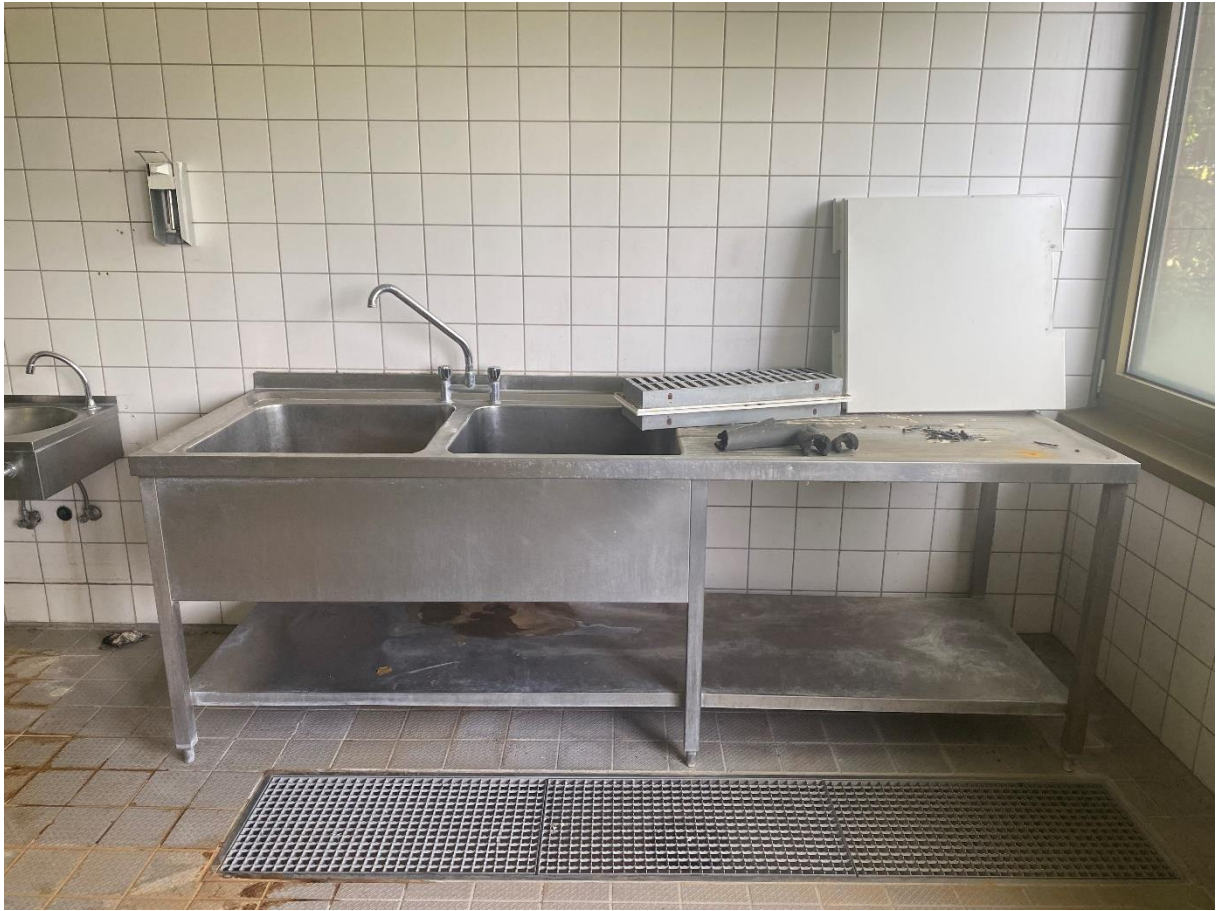
Ein Edelstahlspültisch mit zwei Spülbecken und Ablagefläche.