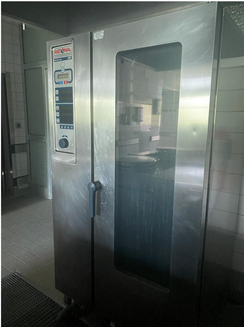
Ein Rational-Kombidämpfer „CPC“, teilweise funktionstüchtig.